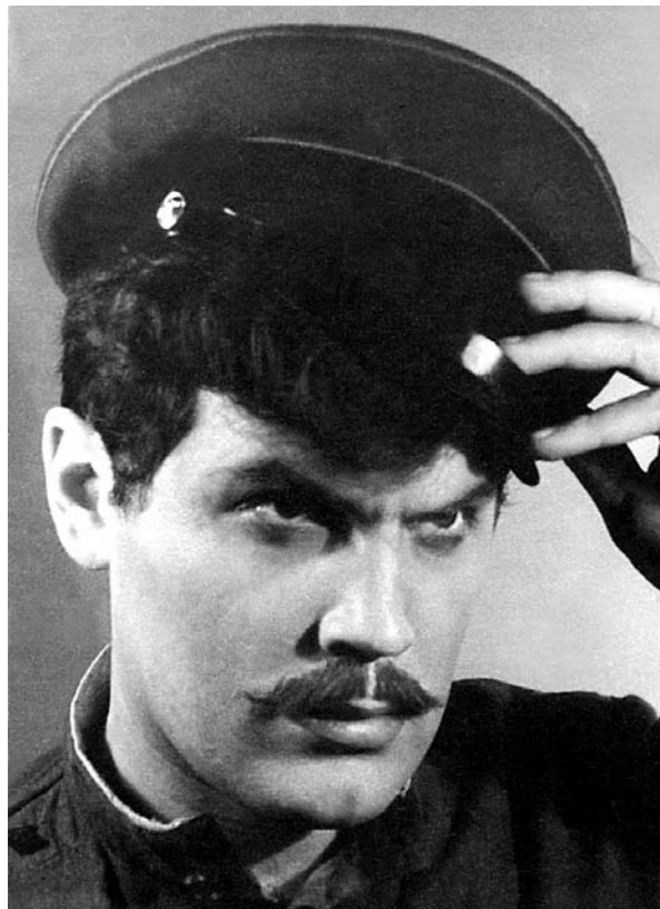
Нар. арт. РСФСР В. З. Гатаев