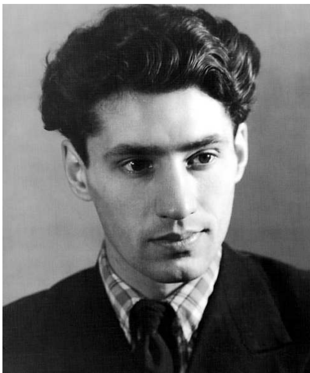
Спартак Васильевич Мишулин – выпускник первой студии при театре, ныне народный артист Российской Федерации, известный киноактер