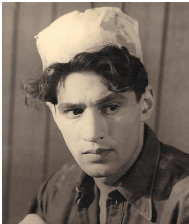
Нар. арт. Российской Федерации С. В. Мишулин в роли Ивана Колосова в спектакле "Не называя фамилий" В. Минко. Режиссер - С.Ф. Владычанский.