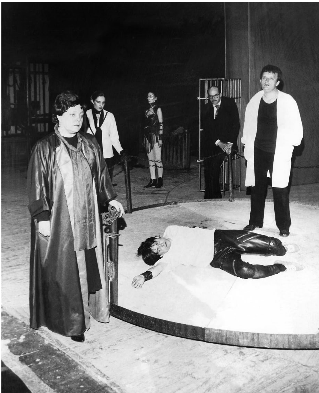
Финальная сцена спектакля