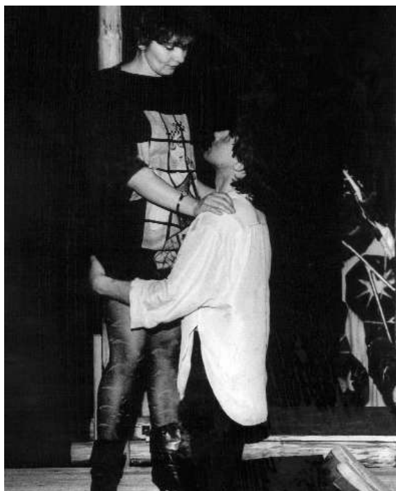
Джил – арт. В. В. Мартыанова Алан – арт. В. О. Кулагин